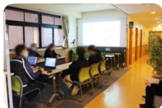
前回の研修の様子